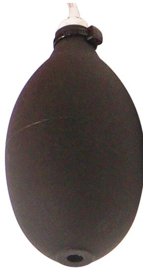
Handpumpe zur Kalibrierung