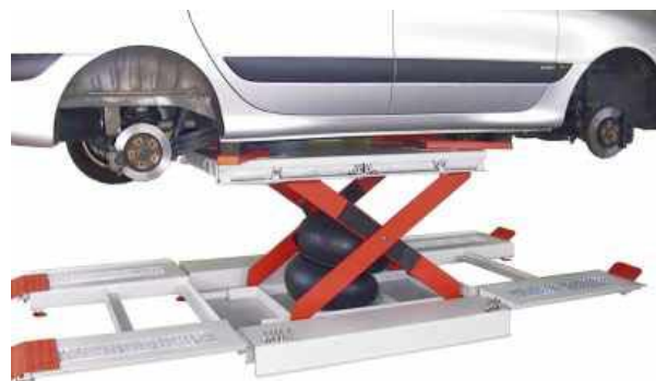
Carry 3.0 Twin

Aufnahme mit ausgekoppelter Radaufstandsfläche. Radfreies Arbeiten möglich.