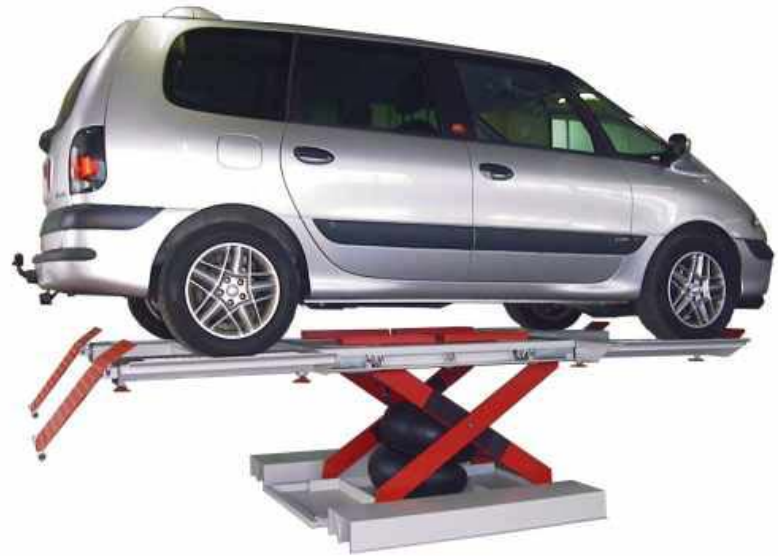
Carry 3.0 Twin